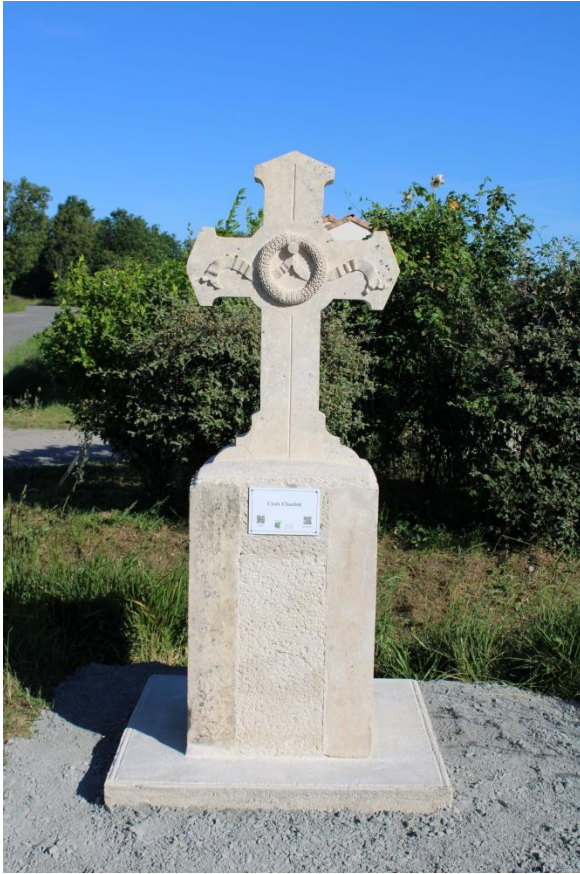
La Croix-Chardon érigée en mai 2026 © HPA, 23 mai 2026